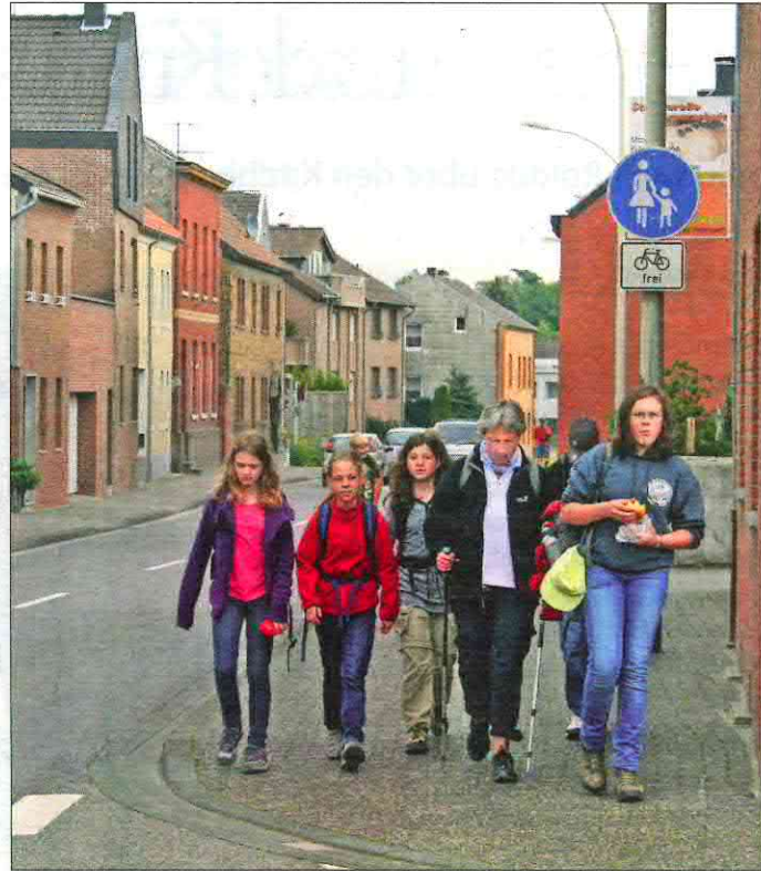
Der Jakobsweg führt die Pilgergruppe mal durch Wiesen und Felder (l.) und mal entlang der Straße, wie hier in Würselen.