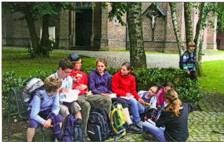
Vor St. Lucia in Würselen-Broichweiden macht die Gruppe Pause.

Was gut ist, denn die l Kilometer sind zäh. Kurz Jubel am Ortsschild „Aac als sie Grenze zur Innens erreichen. In den Gesicht macht sich Müdigkeit bre Ein letztes Mal stimmt ei „Uh alele...“ und alle sin mit. Dann kommt auch s der Dom in Sicht und mi die Vorfreude auf die Elt eine Dusche und ein rich Bett. Beim Abschluss in e Seitenkapelle macht sich etwas Wehmut breit. Ach nächstes Jahr pilgern wi wieder, oder?