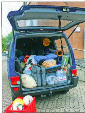
Das gepackte Begleitfahrzeug.

Unterwegs ist das meist kein Problem, alle sind mit Begeisterung dabei. Doch kann auch schon einmal die Grenzen gehen. Wie: Tag zuvor, als die Strecke als länger entpuppte, als eigentlich gedacht. Von Jül (Lich-Steinstrass) ging es den Jakobsweg bis Eschweiler-Kinzweiler und von dort zu ihrem Nachtquartier. Wie: wie sonst etwa sechs Stunden waren sie acht unterwegs.